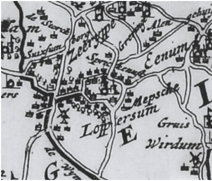
1. Het dorp Loppersum. Uitsnede uit de kaart Groningae et Omlandiae Dominus vulgo De Provincie van Stadt en Lande , van Ludolf Tjarda van Starckenborgh en Nicolaas Visscher II, ca. 1685 (afdruk 1725). (Particuliere collectie).