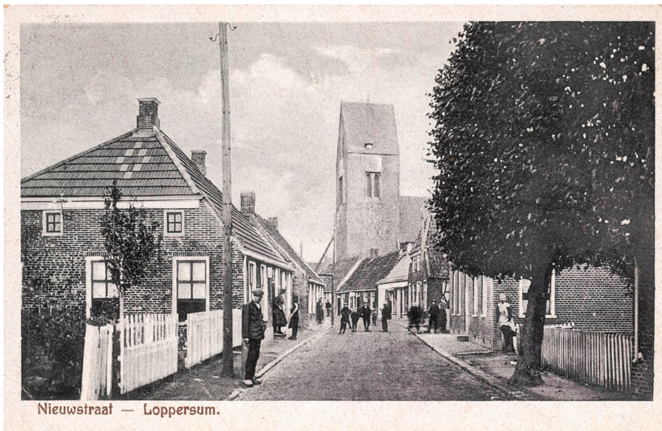
2. De Nieuwstraat in Loppersum, met zicht op de toren, begin negentiende eeuw.

Een inschrijving van Harm Franssens' huwelijk trof ik niet aan. 2 Vanaf januari 1710 tot november 1719 werden er in een strak doorlopende reeks zeven kinderen geboren in het dorp Loppersum, op één na zonder vermelding van de naam van de moeder. Die ene doop (uit 1716) geeft als haar naam Lammegien Dieters, en een drie jaar eerder gedoopte zoon heette dan ook Dietert. Behalve deze laatste liet het echtpaar ook een zoon Mense dopen. Dat maakt duidelijk dat Lammegien een lid van de familie Scherphuis of Scharphuis is, waarin beide voornamen vaak verschijnen. In het uitgebreide nageslacht van de broers van Lammegien komt de naam Albertje steeds terug, en in wat mindere mate ook de voornaam Stijntje. Haar vader was de herbergier Dietert Frericks te Oosterwijtwerd; voor haar moeder gok ik op de naam Albertien [Menses], maar die is in de originele bronnen nog niet aangetroffen.